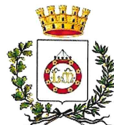
Comune di Montecchio Emilia