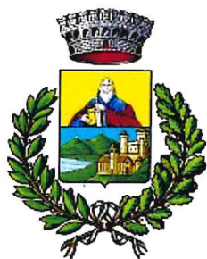
Comune di San Polo d'Enza